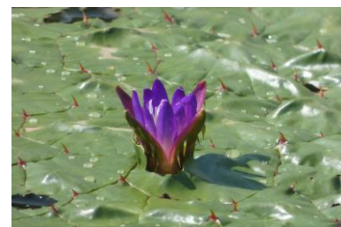
パークセンターのオニバス オニバスは地域によって花卉の付き方など個体差があると言われている。 (令和5年7月22日撮影)