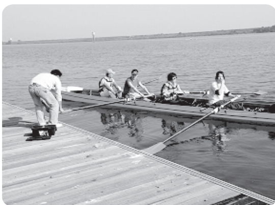
写真は前回の様子です