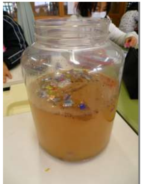
川を汚したのは誰でしょうか