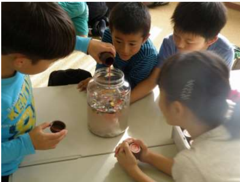
6～10名のグループワークで進めます

パークセンターでもっとも人気の高いプログラム「川を汚したのは誰だ」などを体験した後、園内の施設をご案内します。環境教育講座に関心のある学校やこども会等の団体に所属する方が対象です。 1名様から参加できますので、遠足の下見などにご利用ください。