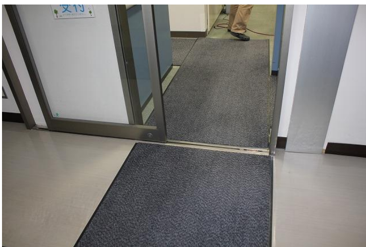
左：管理事務所の窓口の入口

管理事務所の入り口から、廊下、管理事務所窓口まで靴を脱がなくても良いよう、フロアマットを敷きました。靴を脱いだり履いたりする手間が省け、スムーズに窓口をご利用いただけるようになりました。