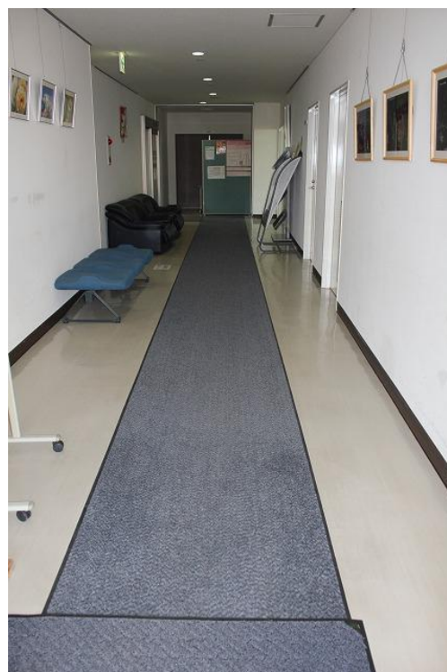
右：管理事務所の廊下